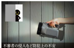
不審者の侵入など防犯上の不安