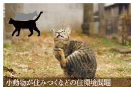
小動物が住みつくなどの住環境問題