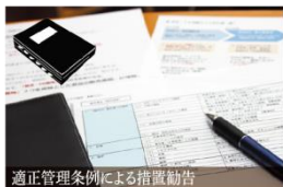
適正管理条例による措置勧告