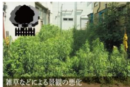
雑草などによる景観の悪化