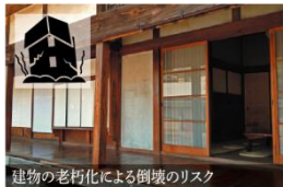
建物の老朽化による倒壊のリスク