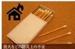
放火などの防災上の不安